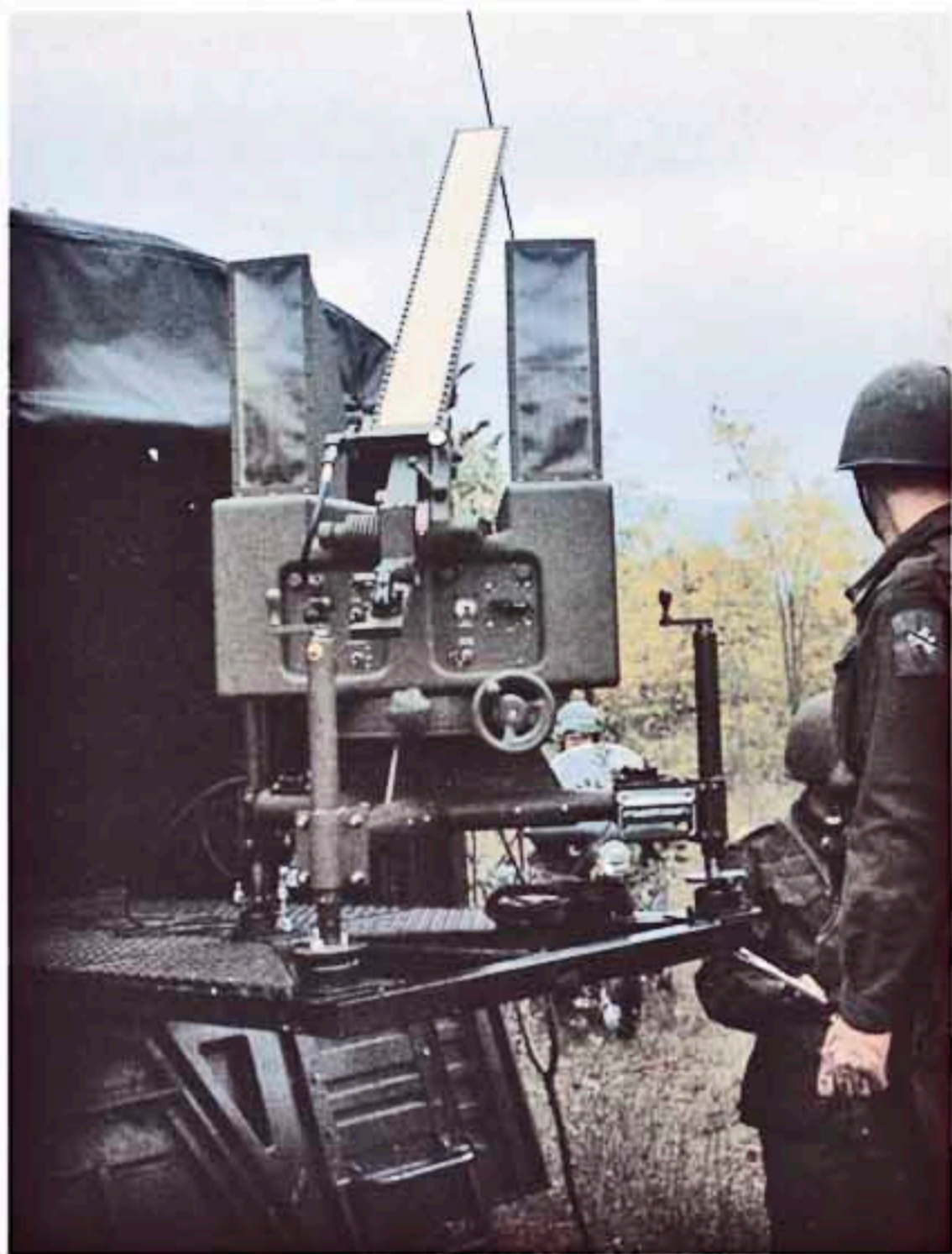
In apertura: lancio di un drone CL-89 della BAT. Il velivolo porterà a termine in meno di un'ora la missione di ricognizione. Sopra: il radiofaro utilizzato per la guida terminale di precisione del drone sull'area di recupero. Sotto: la BAT è dotata di una serie di laboratori ed officine campali che permettono l'immediata revisione e, se del caso, la riparazione dei droni.

Tutti i dati vengono quindi trasmessi alla sezione di lancio, dislocata a distanza dal C.do, mimetizzata e protetta da un dispositivo difensivo ravvicinato. Ricevuti gli ordini, i veicoli si muovono per raggiungere la zona di lancio, la rampa viene posizionata con la massima precisione, si stende il cavo che